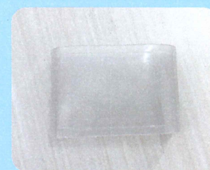
デバイス保護カバー