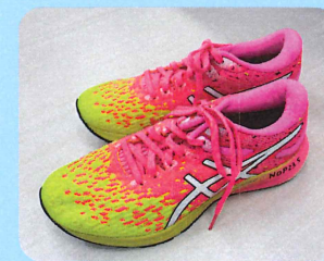
トレーニング室 シューズ