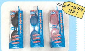
子ども用ゴーグル