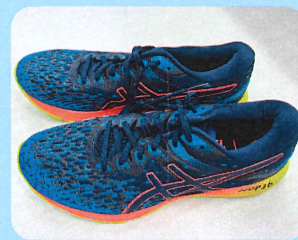
トレーニング室 シューズ