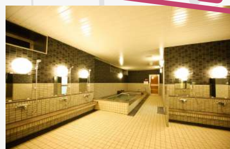
お風呂・シャワー・サウナ