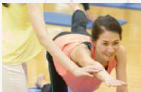
スタジオレッスン